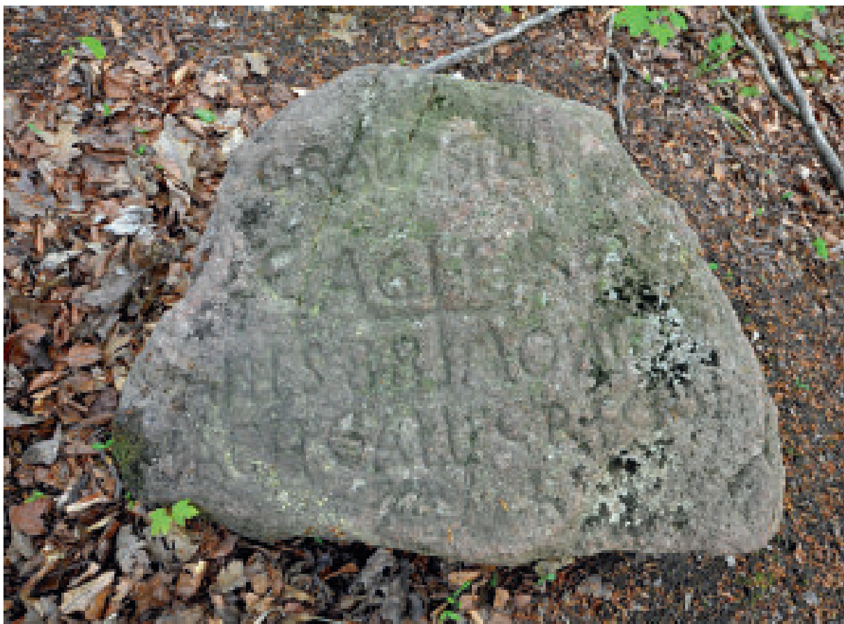
3. Stare Bogaczowice, inskrypcja na odkrytym kamieniu granicznym, fot. A. Miziołek.

Na samym środku kamienia umieszczony został znak „+”, tworzą go dwie krzyżujące się linie o długości 20 cm. Centralnie ponad nim znajduje się wyraz „GRANZSTEIN”, przy czym litery „N” przedstawione zostały tu w ich lustrzanym odbiciu, analogicznie jak i w dalszej części napisu. W lewym górnym rogu znaku „+” umieszczono litery „CAG”, pod nimi zaś, w lewym dolnym rogu, znaki „AN1588”. Stopień zachowania tych inskrypcji jest najlepszy. Znaki z prawej strony kamienia są trudne do jednoznacznego odczytania.