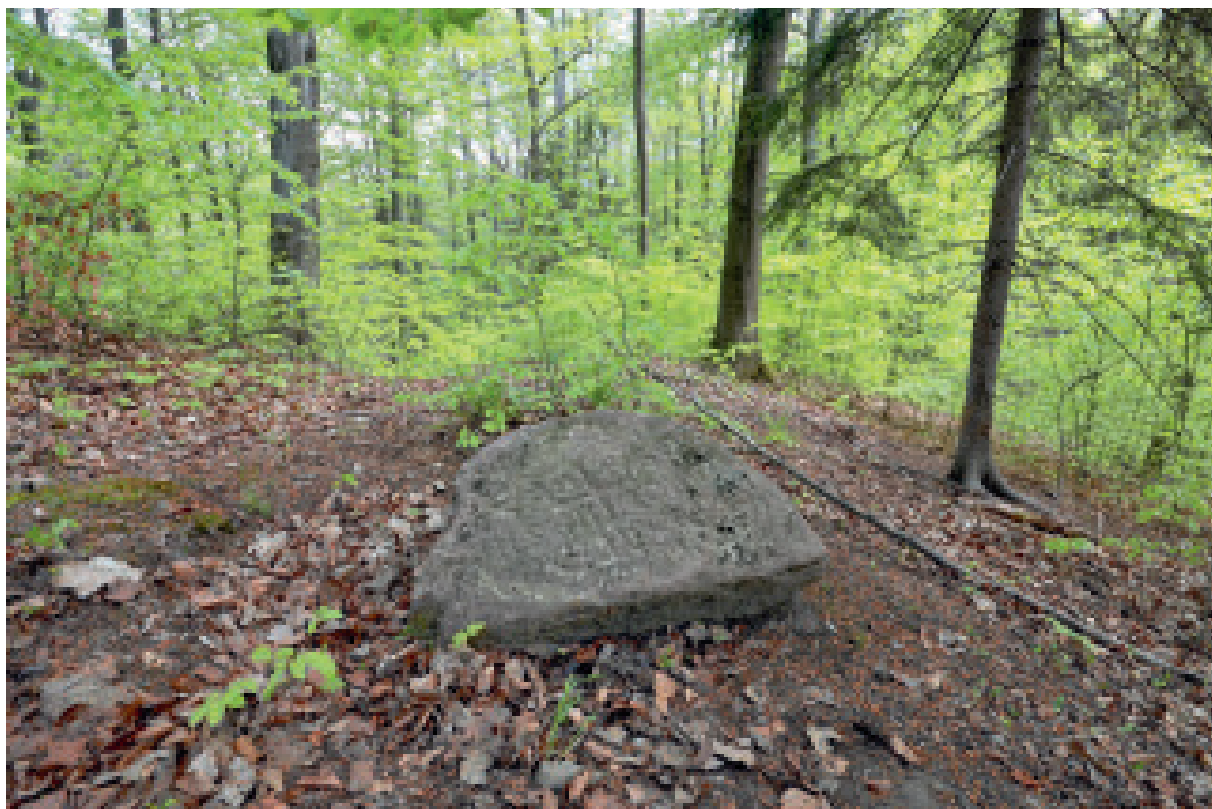
2. Stare Bogaczowice, miejsce na zboczu wzniesienia Czernica, w którym znajduje się odkryty kamień