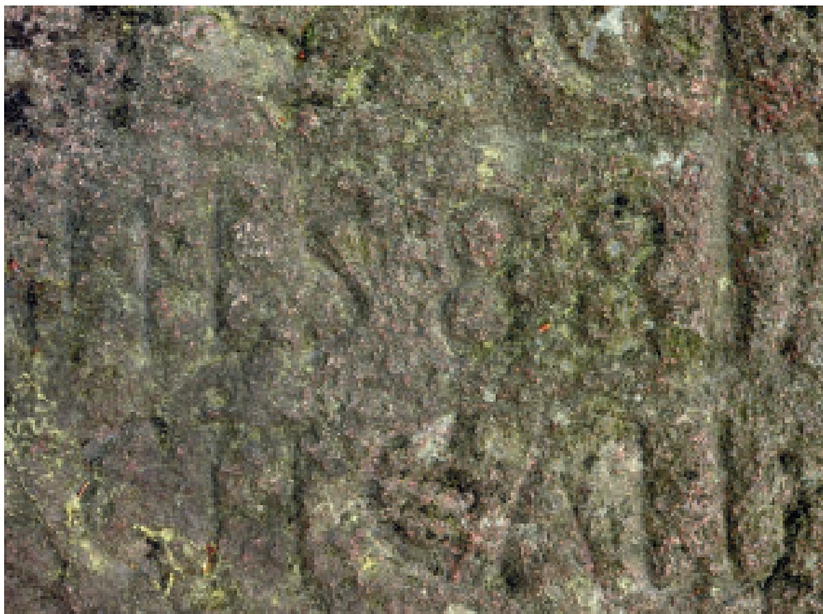
4. Stare Bogaczowice, kamień graniczny, fragment z wyrytą datą 1588, fot. A. Miziołek.

Jakie jest znaczenie umieszczonych na kamieniu rytów? Niewątpliwie widoczny na środku głazu znak „+” świadczy o tym, że jest to znak graniczny. Potwierdzeniem tego jest umieszczony na górze wyraz „GRANZSTEIN”, który prawdopodobnie odpowiada swym znaczeniem współczesnemu niemieckiemu wyrazowi Grenzstein, czyli kamień graniczny. Zlokalizowane w lewym dolnym rogu symbolu „+” znaki „AN 1588” należałoby zinterpretować jako datę usta-